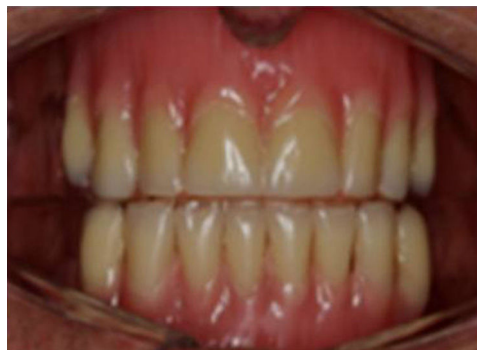
Figura 1 – Aparelho duplo com dentes, somente para efeito estético, assentado diretamente sobre o rebordo alveolar.

Para os voluntários com próteses sem retenção, foram feitas moldagens do rebordo residual pela técnica convencional