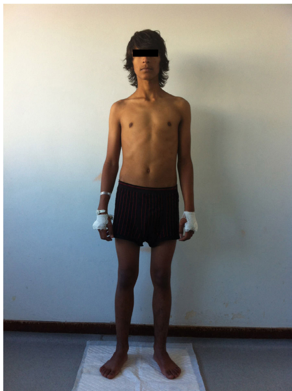
Figura 1. Aspeto emagrecido, hiperpigmentação da pele.

efeitos androgénicos, a DHEA poderá atuar como neurosteróide com possíveis efeitos no humor, capacidade de aprendizagem e bem-estar. Com base na evidência disponível, a substituição não deve ser feita por rotina em doentes com ISR 8 .