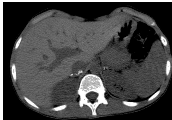
Figura 3. TC das suprarrenais - calcificações em ambas as glândulas suprarrenais.

A radiografia torácica foi pouco esclarecedora, pelo que se avançou para uma TC torácica que mostrou alterações sugestivas de sequelas de doença granulomatosa: «...gânglios de dimensões normais porém calcificados na cadeia paratraqueal direita, na região peri-hilar esquerda e na região pré-aórtica, todos com dimensões infracentimétricas, provavelmente residuais; granuloma calcificado e milimétrico no lobo inferior do pulmão esquerdo...» (fig. 4).