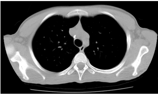
Figura 4. TC torácica – gânglios torácicos calcificados.