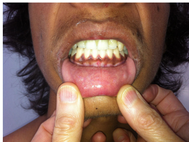
Figura 2. Hiperpigmentação da mucosa gengival.

O estudo analítico evidenciava hiponatremia (113 mmol/L), hipercaliemia (6,2 mmol/L), creatinina 0,73 mg/dL, ureia 78 mg/dL, glicemia 71 mg/dL, ALT/AST 73/50 UI/L. O exame sumário de urina era normal (densidade 1,018, pH 6,5). O sódio urinário