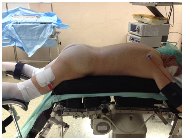
Figura 1. Posicionamento do doente.

A primeira incisão cutânea, com cerca de 2 cm, é efetuada sobre a ponta da 12. a costela. Após preparação do tecido subcutâneo e músculo por dissecação roma, o espaço retroperitoneal é facilmente acessível por perfuração digital da fâscia dorsolombar. A dissecação digital nesse plano permite criar o espaço necessário à colocação de trocarte de 5 mm em posição lateral