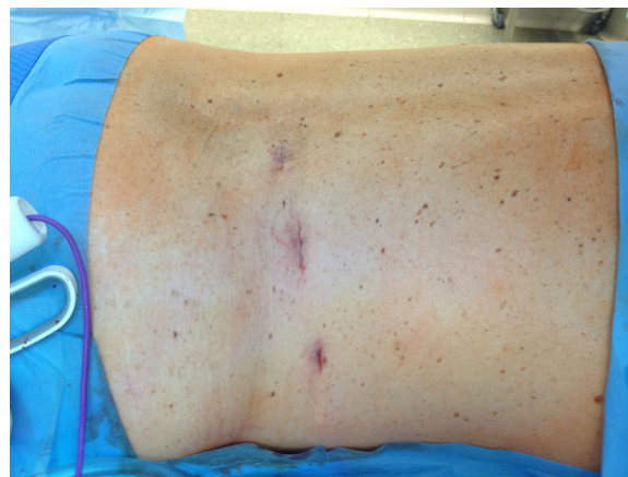
Figura 3. Aspetto pós-operatório.

(aproximadamente abaixo da ponta da 11. a costela), controlada pela introdução do dedo indicador da mão direita na incisão inicial (porta lateral).