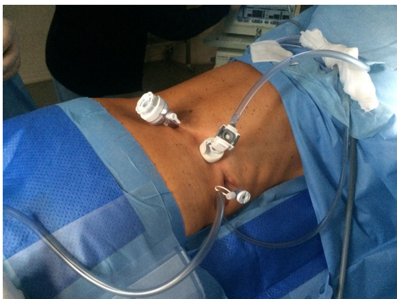
Figura 2. Colocação dos trocartes.