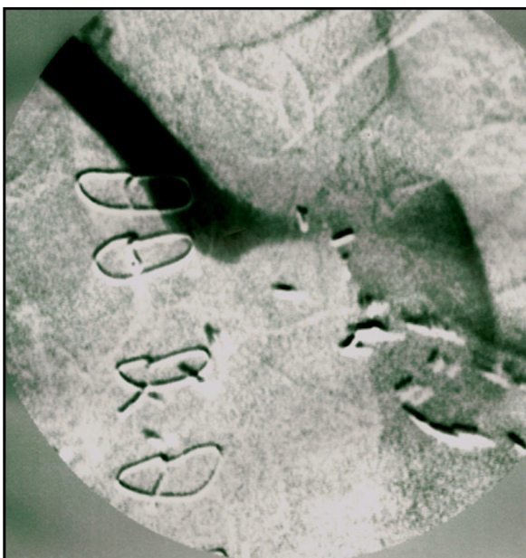
Figura 3 Arteriografia inicial.

No caso descrito, optou-se pelo tratamento endovascular com stenting primário, uma vez que se tratava de um doente com múltiplos fatores de risco cardiovasculares e com esternotomia prévia, tornado a cirurgia aberta menos