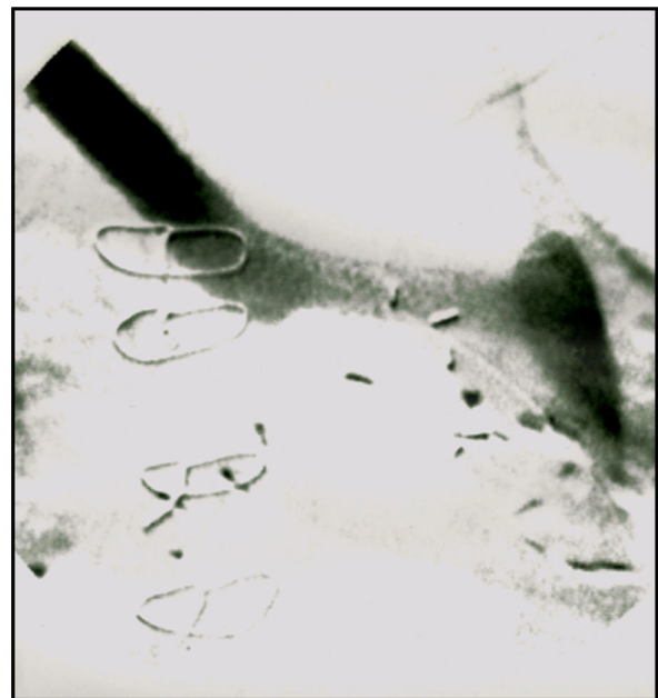
Figura 4 Arteriografia final após stenting da origem da artéria subclávia direita aberrante.