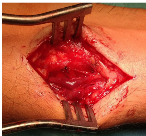
Figura 2 Imagem da fístula intraoperatoriamente.

Sob anestesia local com lidocaína 2%, procedeu-se à exploração do local da punção com identificação de FAV radial (fig. 2). Realizada dissecação de artéria e veia, e laqueação de trajeto fistuloso com Vycril® 3-0, incluindo a veia aferente e eferente, junto ao orifício arterial (fig. 3). Encerramento por planos, sutura intradérmica com Vycril® 4-0. Clinicamente sem frémito após o procedimento e com