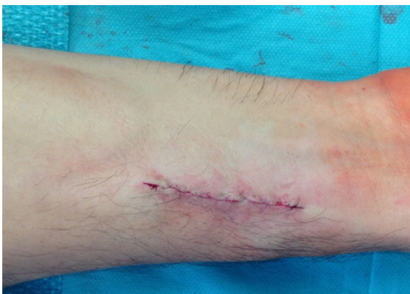
Figura 4 Pós-operatório verificando-se desaparecimento do ingurgitamento venoso.

A maioria dos doentes com FAV radial é assintomática, apresentando-se com massa pulsátil, com frémito ou sopro.