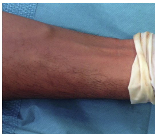
Figura 1 Imagem das veias no pré-operatório.

* Dados do estudo randomizado «Radial versus femoral access for coronary angiography and intervention in patients with acute coronary syndromes» (RIVAL trial 2 ).